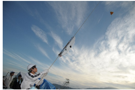
SPEC 宇宙エレベーターチャレンジ